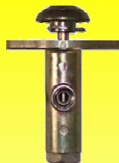
LC672HV VALVULA P/ CORNETA AIRE PIE REYMAC