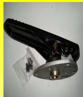
P-278855 BASE C/PEDAL COMPLETO E-6 / E-2