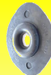
RD RETEN DE DUAL 2 HOYOS