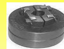
CGDE COPLA GDE. F II RODAN C/ESTRELLA POLIURETANO