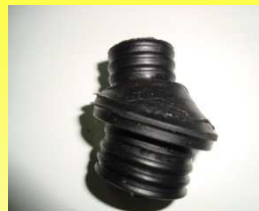
CCM CODITO COPLA COMPRESOR MERCEDEZ OM-366