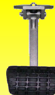
P-279950 BASE C/PEDAL COMPLETO E-7 / E-5