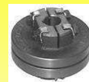
CMED COPLA MEDIANO F II RODAN C/ESTRELLA POLIURETANO