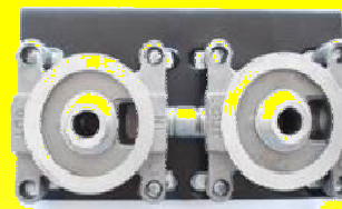
6354 BASEP/FILTRO DE COMBUST.GP11 DOBLE