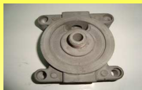
6370 BASE P/FILTRO DE AGUA SENCILLO