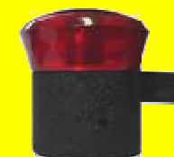
LC500-S VALVULA P/DUAL T/SELECTOR REYMAC