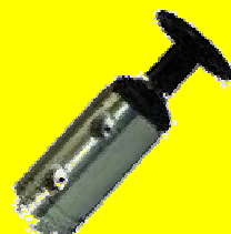
E747-ENCAR VALV. D/ALUMINIO P/DUAL O PUERTA (ENCAR)