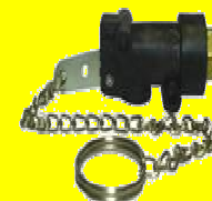
LC4227 VALVULA P/CORNETA AIRE JALON PLASTICA REYMAC