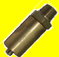
205105 VALVULA SEGURIDAD 1/4 NACIONAL