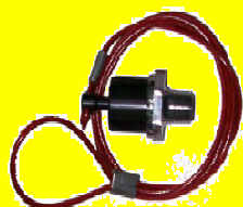
1150 GRIFO DE JALON