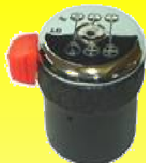
LC600-C VALVULA P/DUAL T/CONVERTIDOR REYMAC