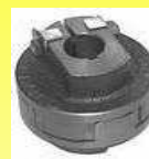
CCH COPLA CHICO F 1 RODAN C/ESTRELLA POLIURETANO