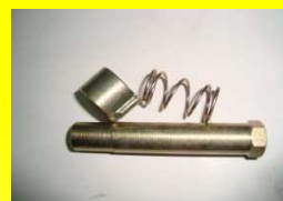
6332 RPTO. MATRACA MIDLAND