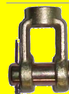
228790 HORQUILLA 1/2 X 1/2