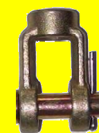
228791 HORQUILLA 5/8 X 1/2