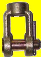
228798 HORQUILLA 5/8 X 5/8