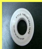
6364 CINTA TEFLON