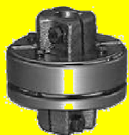
CMG COPLER MEDIANO GAJOS F IV RODAN C/ESTRELLA POLIURETANO