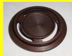
18023-500 ASIENTO ADMISION COMPRESOR CUMMINS