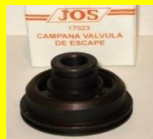
17023-500 CAMPANA ESCAPE COMPRESOR CUMMINS