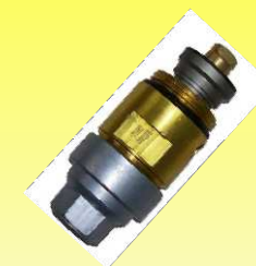
CA-1000-500 CARTUCHO VALV. A1000 T/SEALCO