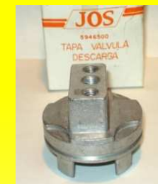
5946-500 PORTA TAPA GOBERNADOR HORIZONTAL