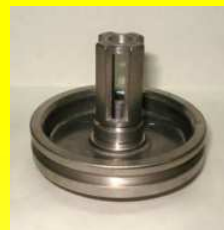
4661-IE7-500 CANASTILLA INTERIOR VALV. PIE E-7