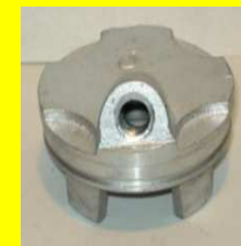
1859-500 PORTA GOBERNADOR AUN LADO