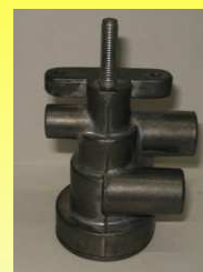
99600-500 VALVULA ESTACIONARI O D-500