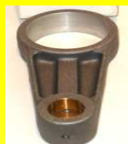
4067-500 BIELA COMPRESOR CUMMINS