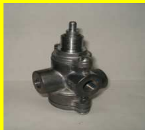
11801-500 VALV. ESTACIONARI O D-600