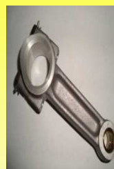
9085-500 BIELA COMPRESOR TF-500