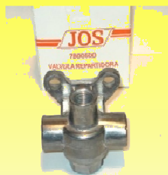
7800-500 VALV. ESCAPE RAPIDO TIPO SEALCO