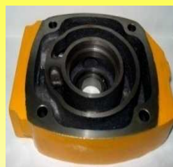
6150-500 CABEZA COMPRESORA CUMMINS