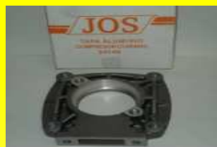
34149-500 TAPA CABEZA COMPRESOR CUMMINS