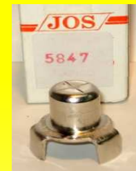
5847-500 BUJE 3 PATAS (TREBOL)