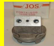
1858-500 PORTA TAPA GOBERNADOR INCLINADO